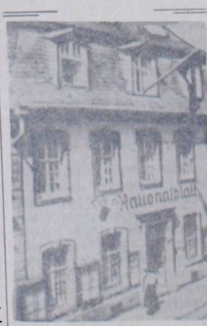
Дом в Трире, в котором родился Карл Маркс.

Первым практическим опытом революционного завоевания власти пролетариатом явилась Парижская коммуна. Несмотря на поражение, она подтвердила правильность теоретических выводов научного коммунизма, показала огромную силу революционного рабочего движения.