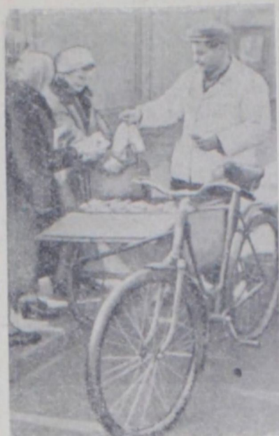
Ленинград. Торг «Ленмолоко» Выборгского района организовал продажу молока по домам. Для этого оборудованы специальные трехколесные велосипеды.