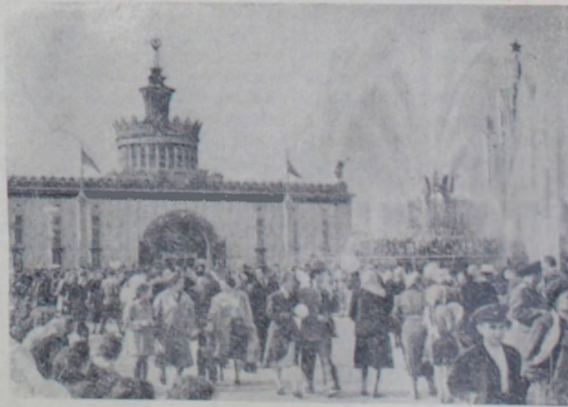
Всесоюзная сельскохозяйственная выставка. На площади колхозов.

В течение дня на ВСХВ прои-зошли также встречи передовиков сельского хозяйства в павильонах «Пчеловодство», «Узбекская ССР», «Северный Кавказ» и ряде других.