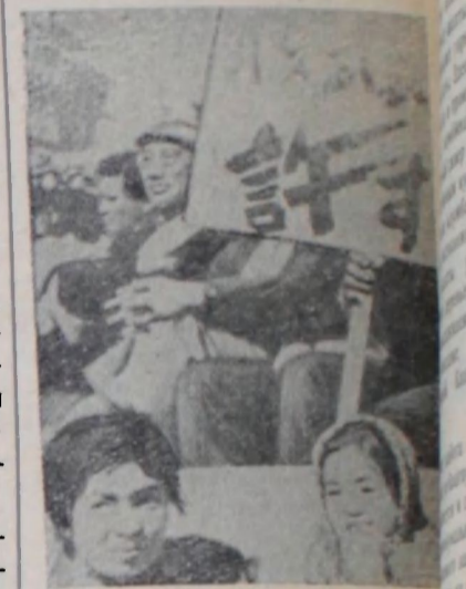
На снимке: группа участников митинга. Надпись на плакате гласит: «Требуем установлен безатомной зоны».

стремление к единству и заявляют о своей решимости бороться за победу демократических сил на предстоящих парламентских выборах.