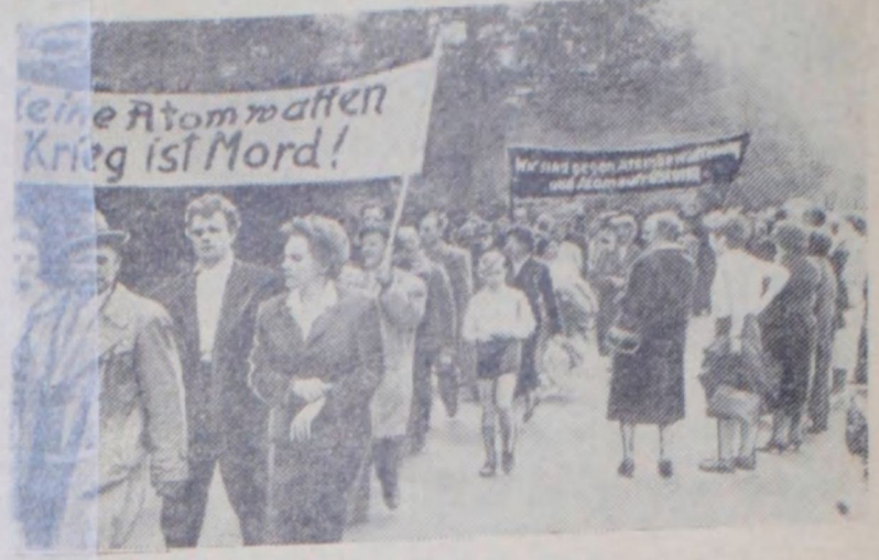
* Федеративная Республика Германии. В Гамбурге состоялась демонстрация и митинг протеста против атомного вооружения. В митинге, проведенном на кладбище в память жертвам фашизма, приняли участие тысячи людей. На снимке: участники демонстрации несут лозунги — «Никакого атомного оружия, война — это убийство!» «Мы против атомного вооружения!» *