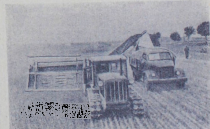
Ровенская область. Колхозники и механизаторы сельскохозяйственной артели «Здуботок Жовтня» Ровенского района решили заготовить в нынешнем году по 18 тонн силоса на каждую корову.