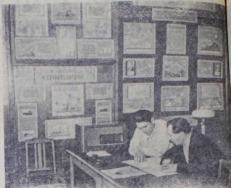
Ленинградская область. В Тихвинском райкоме КПСС организован кабинет передового опыта. В нем представлены документы отражающие борьбу колхозников района за увеличение выпуска сельскохозяйственной продукции, опыт передовиков животноводства и полеводства.