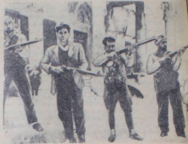
Повстанцы на улице Бейрута.