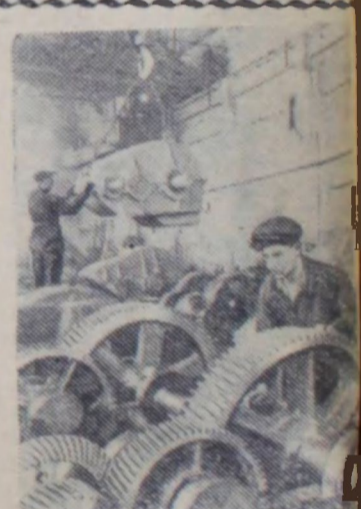
Продукция завода «Красный таллист» Управления тяже-ло машиностроения Ленинград-ского совнархоза широко известна пределами Советского Союза: пускаемые предприятием режу-ры для подъемных кранов и-ляются в Китай, Вьетнам, Ри-нию, Польшу, Сирию.

Машина, обладающая такой большой производительностью, изготовляется впервые в нашей стране.