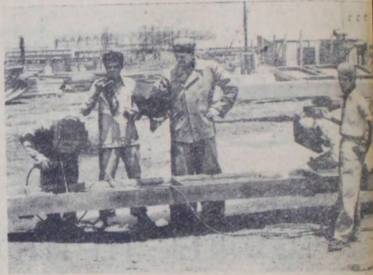
Индия. На строительстве металлургического завода в Бху сооружаемого при помощи Советского Союза. Сварочные работы ведут совместно индийские и советские рабочие. На снимке: советский сварщик обучает индийских рабочих.

Предстоящий конгресс привлекает к себе большое внимание. Несмотря на злобные выпады отдельных органов буржуазной печати, стремящихся помешать участию в конгрессе шведских организаций, шведская делегация будет одной из многочисленных.