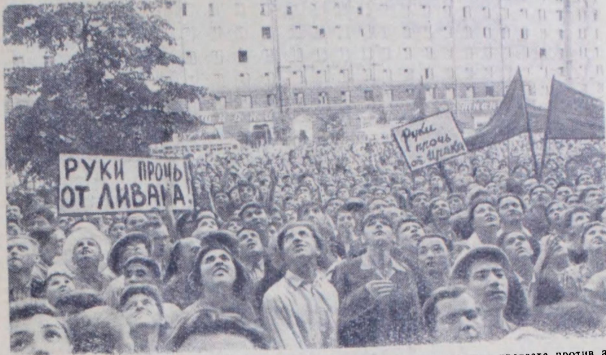
Москва. У посольства Соединенных Штатов Америки состоялась демонстрация протеста против аг- рессии США в Ливане.

На снимке: у посольства США во время демонстрации