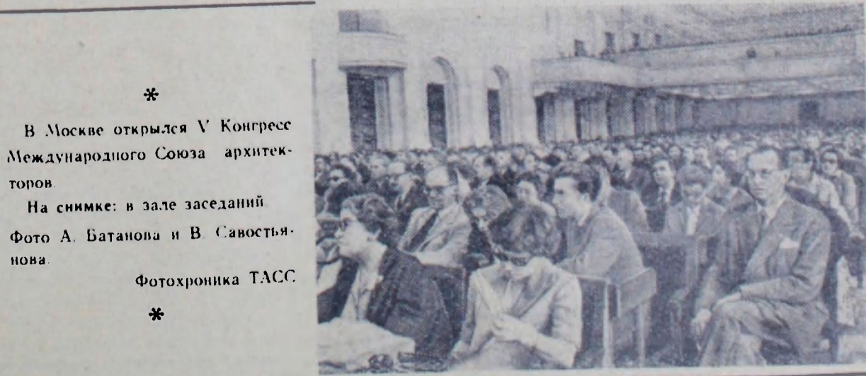
В Москве открылся V Конгресс Международного Союза архитекторов.

Среди библиотек первого места удостоены: Сланцевская районная, Волосовская городская и детская, сельские библиотеки: Рождественская — Гатчинского, Городецкая — Лужского и Колчановская — Новолодожского района.