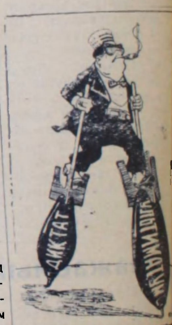
С «позиции силы» или американские ходы

После выступления Макмиллана началось закрытое заседание.