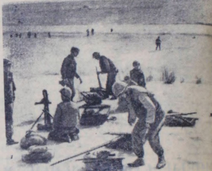
Американская морская пехота после высадки в Халык Бейрута.