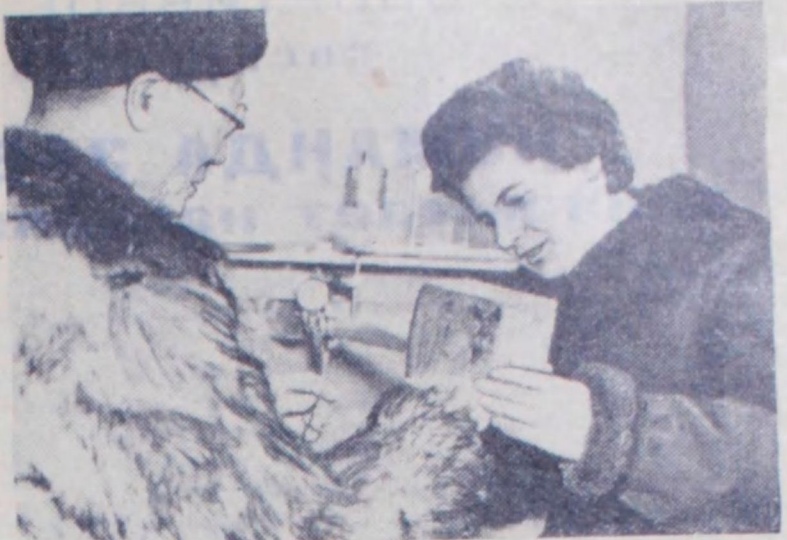
Якутск. Северо-Восточное отделение Института мерзлотоведения имени В. А. Обручева Академии наук СССР на протяжении ряда лет занимается изучением условий распространения и залегания вечной мерзлоты на территории Якутской АССР, их физико-механических свойств для решения вопросов, связанных с особенностями проектирования и строительства промышленных сооружений в условиях Крайнего Севера.

Благодаря трудовым усилиям всего коллектива механизаторов Рудненской РТС за летний период вывезено на поля колхозов 9 тысяч тонн торфа. Выполняя взятые на себя социалистические обязательства, механизаторы на деле помогают труженикам колхозов в борьбе за высокий урожай. Торф идет на поля! П. ГОРБУНОВ.