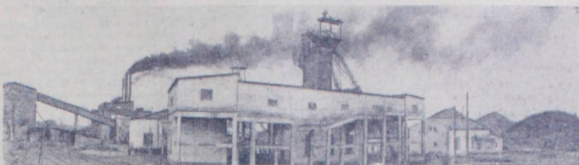
На снимке: панорама наземных производственных сооружений шахты имени С. М. Кирова.