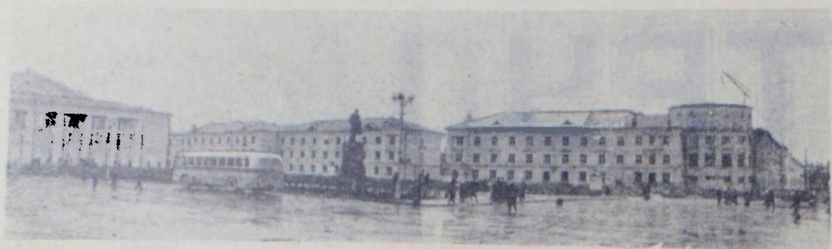
На снимке: памятник Владимиру Ильичу Ленину в городе Сланцы на площади, носящей имя вождя