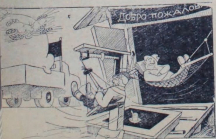
Урожай: — Долго вы будете раскачиваться!