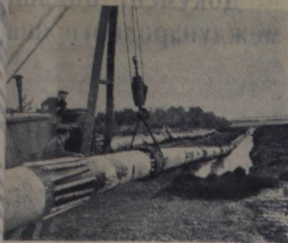
...ая область. На территории области ведется проклад- газопровода Ставрополь — Москва. Здесь трудятся ги механизированных колонн строительного управле- «Шекингазстрой». Колонны оснащены новейшей тех- : укладка труб в траншею в пойме реки Тихая Сосна.