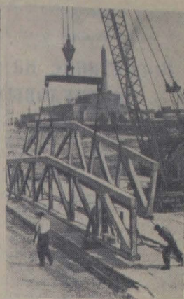
Барнаул. На строительной площадке завода искусственного и синтетического волокна сооружен открытый полигон для изготовления железобетонных ферм. Эти фермы пойдут на строительство цеха капронового волокна.

шадных сил. В отличие от машин прежних образцов он снабжен не цепной, а карданной передачей, что обеспечивает более длительную эксплуатацию и надежность в работе. Кабина мотовоза обогревается.