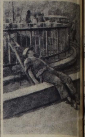
Согласно явно преувеличенным цифрам, опубликованным южнокорейской печатью, в Южной Корее насчитывается более 3.800.000 безработных и полубезработных.

На снимке: безработный, ушедший от голода на улице.