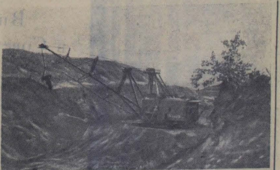
Амурская область. В угольной промышленности Дальнего Востока успешно применяется современная высокопроизводительная техника отечественного производства. Так, на вскрышных работах в нескольких угольных разрезах комбината «Дальвостуголь» используются мощные шагающие экскаваторы.

На строительстве первой очереди канала предстоит вынуть сорок два миллиона кубометров земли, уложить в набережные и распределительные устройства дамбу двадцать тысяч кубометров бетона. Три мощные насосные станции поднимут воду на семьдесят четыре метра выше уровня Иртыша.