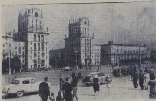
Минск. Привокзальная площадь.