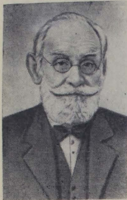
И. П. ПАВЛОВ.

Прекрасную жизнь прожил Иван Петрович Павлов — великий русский ученый, постигший законы высшей нервной деятельности человека, особенности его психики. Ежегодно 26 сентября, в день рождения этого выдающегося деятеля науки, советская общественность отмечает его память научными заседаниями, экскурсиями по местам, где жил и работал ученый.