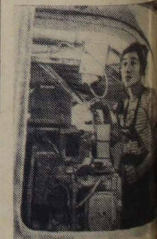
Редактор Н. АШМАНОВ.

«Ни один американец, не говоря уже о мире во всем мире, не должен быть принесен в жертву обороне Кузюм и Мацзу», — заявляет Лимэн. — Эта оборона связана ни с каким-либо моральным или юридическим принципом и она не оправдывается какими-либо важными американскими интересами». Автор письма расценивает политику США, в результате которой они оказались «в изоляции в одиночку на грани мирового хаоса».