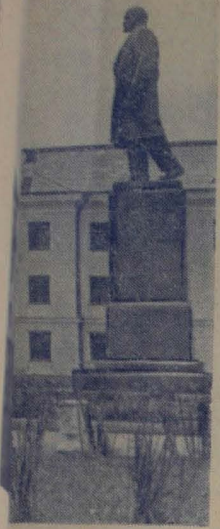
Ленина. Весной этого

Колхозники нашей сельхозартели отмечают всенародный праздник — 41-ю годовщину Великого Октября в обстановке большого политического подъема. Выполняя исторические решения XX съезда КПСС и свои обязательства по дальнейшему развитию всех отраслей хозяйства, мы добились в 1958 году значительных успехов. Урожайность зерновых культур и картофеля в целом по колхозу увеличилась в сравнении с 1955 годом в два раза, а корнеплодов и силосных культур — в полтора раза.