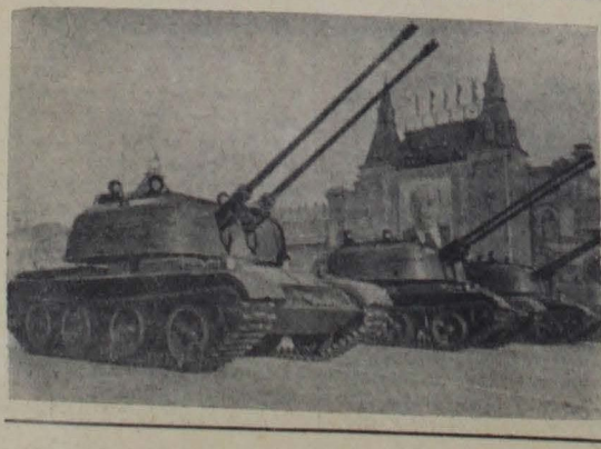
Москва. 7 ноября 1958 года. Празднование 41-й годовщины Великой Октябрьской социалистической революции.

Из рядов участников демонстрации здравницы Коммунистической партии, вальной великом Ленином нашей наш народ к новым коммунизма, в честь года парад-социдателя. Боец тысяч ленинградцев участие в демонстрации, ценной 41-й годовщине Октября. В 20 часов над Новой мели залпы салюта, торжественно праздничным освещены тысячи ленинградцев площадях и проспектах. Участие в народных демонстрациях.