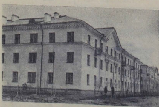
На снимке: новый 33-квартирный дом по улице Жуковского, который будет сдан в эксплуатацию в этом году.

Н. ЗЕВАКИН, бригадир электромонтажников строительного управления № 6 треста «Севзалэлектромонтаж».