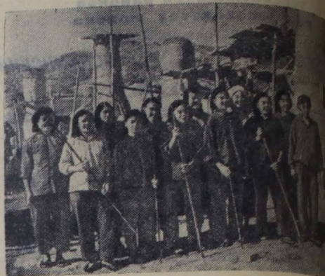
В Китайской Народной Республике, кроме крупных металлургических заводов, создаются небольшие предприятия местного типа. Они обеспечивают металлом народные коммуны, местные производства товаров народного потребления. Среди предприятий производства металла — рабочие уезда Лушань в провинции Чжэньцзян. Они добились ежедневной выплавки металла свыше тысячи тонн. Среди лучших производителей — много женщин. На снимке: женская бригада плавильниц имени Хуа Чжунцзинь, добившаяся значительных успехов в производстве металла.