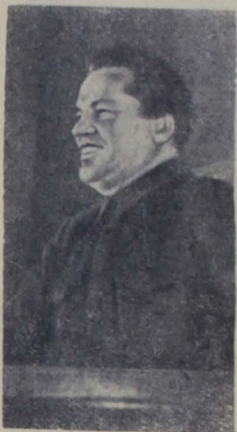
С. М. КИРОВ.

Не забыли сланцевские строители советы Кирова об улучшении организации труда, о повышении производительности квалификации, о техническом прогрессе. Вместо ручной и конной откатки, существовавшей в ту пору на опытной шахте, сейчас во всех шахтах комбината организована электро-