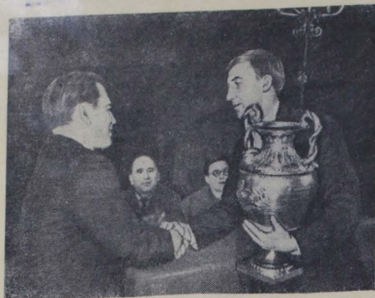
На днях в Центральном театре Советской Армии состоялся вечер, на котором подведены итоги летнего спортивного сезона. На вечере футболистам московского «Спартак», которые в этом году завоевали первенство страны по футболу и кубок СССР, были вручены золотые медали чемпионов страны.

Буржуазная газета «Ро» помещает без подробные выдержки из ноты Советского правительства первые отклики на столицах западных стран. Газета «Вашингтон Пост» сообщает, что согласие Запада на оккупацию Западного Берлина означало бы «сдвиг центра тяжести силы».