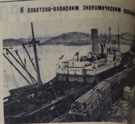
К советско-японским экономическим связям Приморский край. Через дальневосточный порт Находка увеличился поток грузов в Японию, с которой недавно заключено соглашение о регулярной грузопассажирской связи между портом Находка и портами Японии. Систематически поддерживаются контакты с деловыми кругами Советского Союза одна из крупных японских фирм «Сого Бейки Кайся Когай» Она покупает в СССР главным образом уголь и лес. В 1958 году эта фирма закупила 100 тысяч тонн угля и 75 тысяч кубометров леса, что значительно превышает ее заказы в прошлые годы. В Советский Союз фирма экспортирует таллопрокат, стальные тросы и другие товары. На снимке: в порту Находка. Погрузка на пароход «Мару» леса, закупленного японскими фирмами.