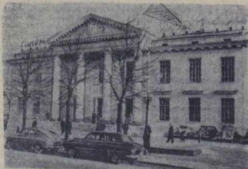
Ленинград. На Потемкинской улице открыт панорамный кинотеатр «Ленинград». Зрительный зал рассчитан на 1.130 мест.