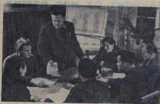
Латвийская ССР. В колхозе «Авангард» Елгавского района составляется семилетний план дальнейшего развития артельного хозяйства. В 1965 году здесь на каждые сто гектаров сельскохозяйственных угодий будет произведено не менее 1.100 центнеров молока и 120 центнеров мяса, урожай зерновых составит около 30 центнеров и сахарной свеклы — 350 центнеров с гектара.

Колхозники решили выступить в соревнование за право называться коллективом коммунистического труда.