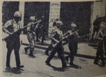
Бразилия. Стоимость жизни в стране продолжает расти. Ли города Сан-Паулу переживают еще одно повышение цен на основные продукты питания — мясо, сахар, бобы, макароны. Префект Сан-Паулу дал распоряжение повлиять на проезд на автобусах на 50 процентов.