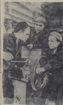
Коллектив завода «Русский ди- зель» на 39 дней раньше срока завершил план текущего года по выпуску валовой продукции и сейчас продолжает настойчиво трудиться над осуществлением обязательств, взятых в честь XXI съезда КПСС.