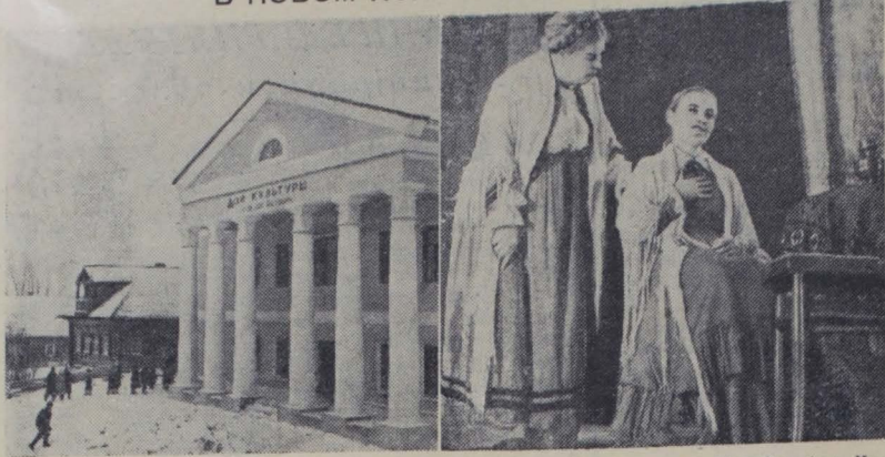
Костромская область. Исполнилось 30 лет сельскохозяйственной артели «12-й Октябрь» Костромского района. В дни юбилея в селе Саметь, где живут колхозники этой артели, открылся новый Дом культуры. Колхозный драматический кружок показал на клубной сцене пьесу А. Н. Островского «Бедность не порок».