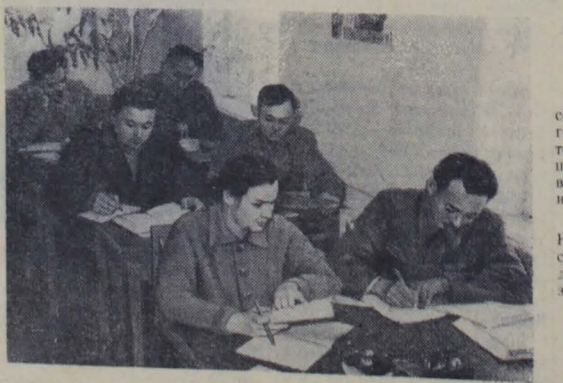
Кара-Калпакская АССР. В сети партийного просвещения города Нукуса проводят занятия 104 пропагандиста, прошедшие подготовку в вечернем университете марксизма-ленинизма и на курсах пропагандистов. На снимке: в читальном зале Нукусского Дома политического просвещения. Пропагандисты готовятся к проведению занятий в политкружках.