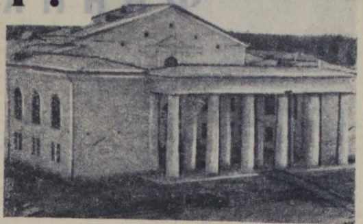
На снимке: Дом культуры комбината «Сланцы».

„Вопросы литературы и искусства нельзя рассматривать в отрыве от тех насущных задач, которые решают сейчас Коммунистическая партия и советский народ по дальнейшему подъему экономики и культуры нашей страны“.