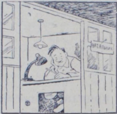
— А у меня не дымно и не пыльно.

этаже, вручную, с помощью «Дубинушки» поднимают груз (дверные полотна, рамы, брусья и т. д.) на второй этаж, где находится сборочное отделение цеха. А подъемник простаивает.