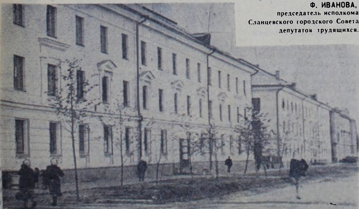
На снимке: поселок Большие Лучки. Улица Маяковского.