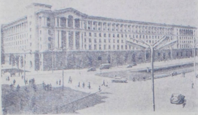
Народная Республика Болгария. Здание министерства электрификации в Софии.