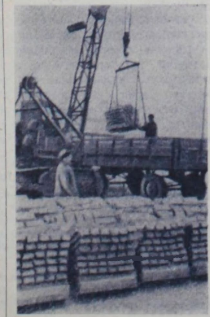
На снимке: отгрузка кирпича на поддонах на заводе «Красная звезда» Всеволожского района.