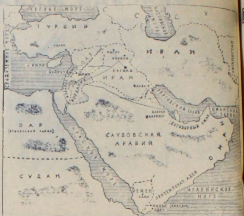
Карта Ближнего и Среднего Востока.