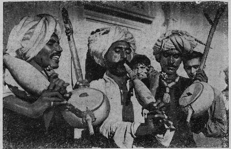
Пакистан. Синдхи музыканты (Западный Пакистан).