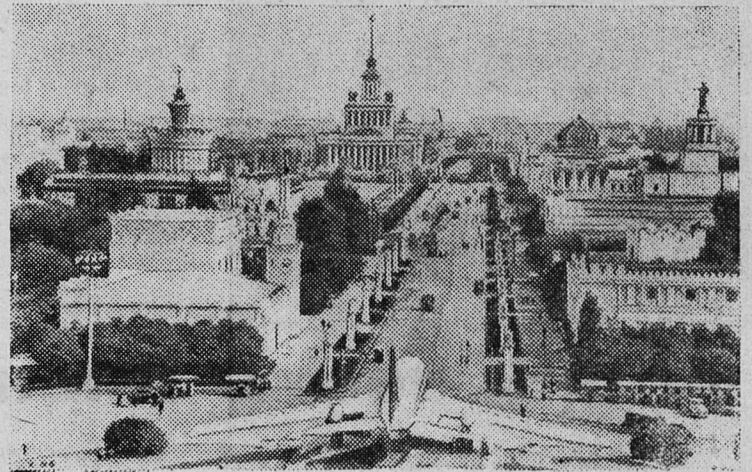
Москва. Выставка достижений народного хозяйства СССР.