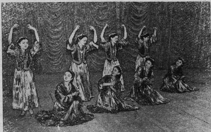
Ташкент. Молодежная группа ансамбля народного танца «Бахор» готовится к поездке на VII Всемирный фестиваль молодежи и студентов в Вене.

Спектакль «Платон Кречет» в 17-й раз поставлен коллективом рабочего театра драмы. Его просмотрели также трудящиеся гор. Кингисеппа, Гдовского района и текстильщики Нарвы.