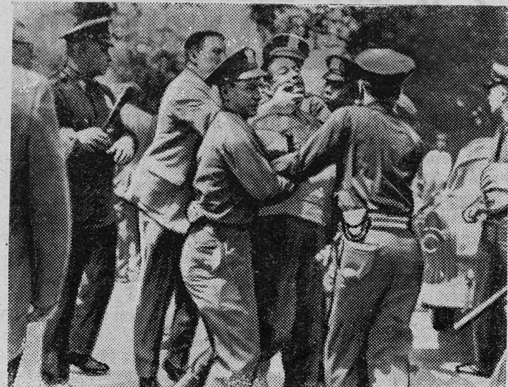
Соединенные Штаты Америки. Полиция разгоняет пикет бастующих работников нью-йоркских больниц.