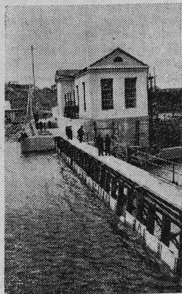
Мордовская АССР. В Рыбинском районе на реке Мокше слана в эксплуатацию межколхозная ГЭС мощностью 385 киловатт. На снимке: общий вид станции.