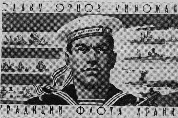
Плакат художницы А. Красицкой (Государственное издательство изобразительного искусства).

Н. ГЛАДОВА, бригадир совхоза «Родина» Дер. Казино.