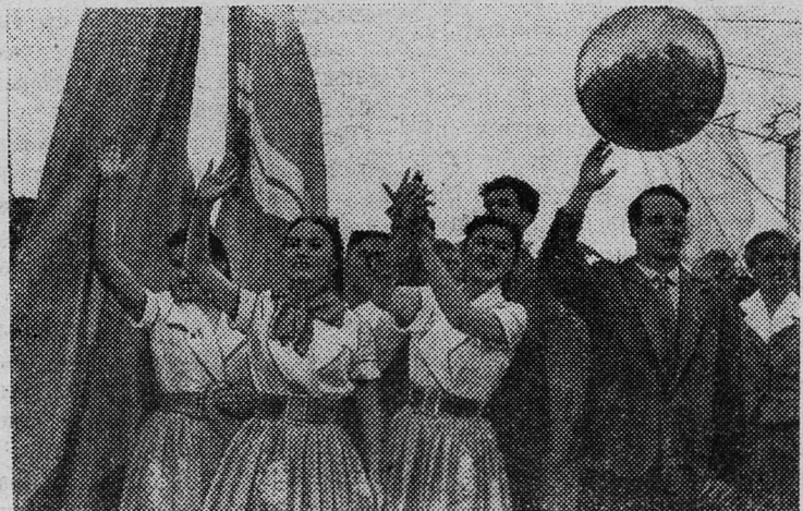
Вена. VII Всемирный фестиваль молодежи и студентов. Советская делегация на Венском стадионе.