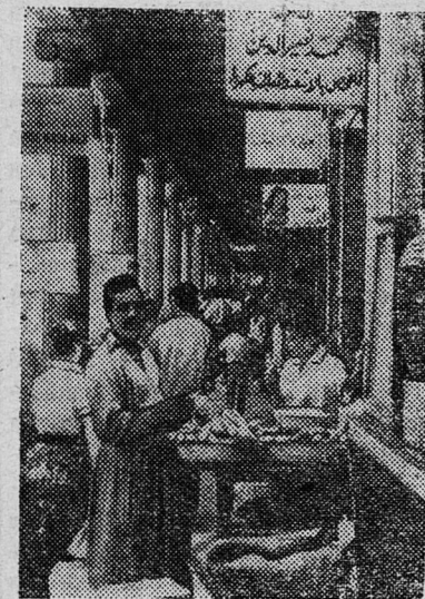
Иракская Республика. На улицах Багдада.

Как сообщает газета «Майници», большинство солдат нового набора будет служить в модернизированных подразделениях. Некоторая часть их будет направлена в США для обучения ракетному делу. Вернувшись из США, они станут костяком планируемых подразделений управляемых снарядов.