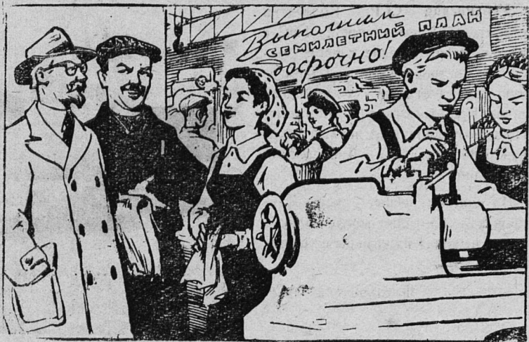
— А вот юноши и девушки, окончив десятилетку, взялись за семилетку.