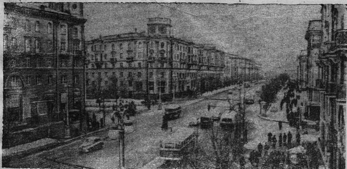
Белорусская ССР. Проспект имени Сталина в столице республики — Минске. Фотохроника ТАСС