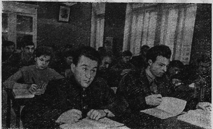
ЛЕНИНГРАД. В 179-й вечерней школе Петродворца занимается более пятисот рабочих и служащих города.

Сессия заслушала информацию зам. председателя горисполкома т. Новикова о ходе выполнения решений предыдущих сессий: «О мерах по улучшению бытового обслуживания трудящихся города Сланцы и района», «О мероприятиях по благоустройству города и населенных пунктов района», «О состоянии и мерах улучшения торговли и общественного питания в городе и районе».