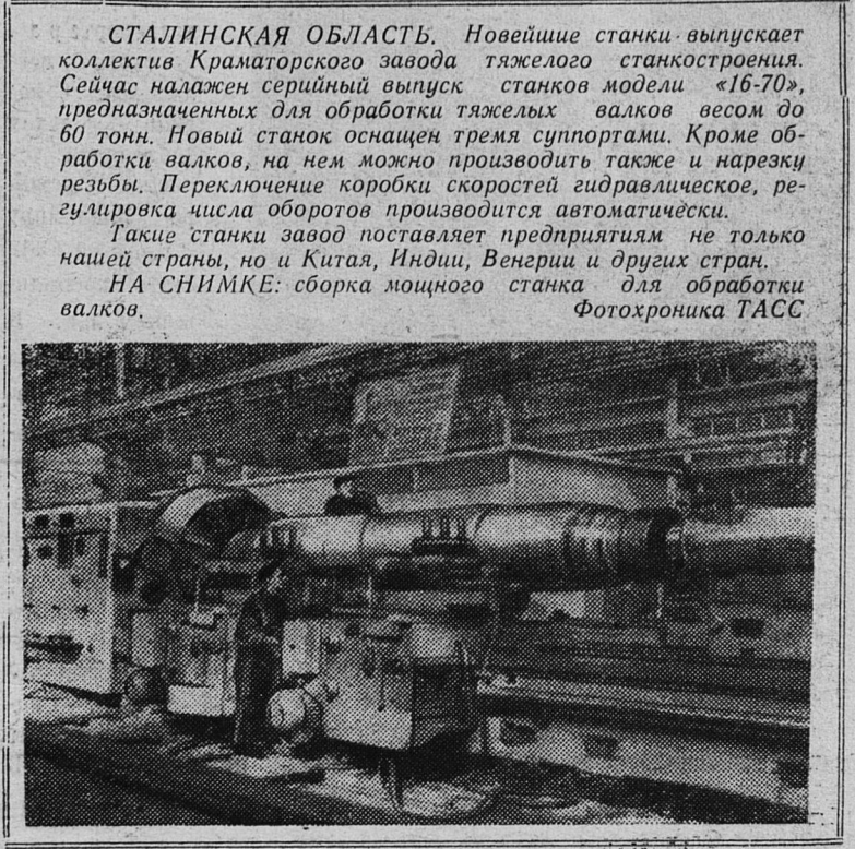
СТАЛИНСКАЯ ОБЛАСТЬ. Новейшие станки выпускает коллектив Краматорского завода тяжелого станкостроения. Сейчас налажен серийный выпуск станков модели «16-70», предназначенных для обработки тяжелых валков...