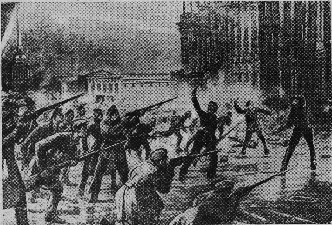
На снимке: ШТУРМ ЗИМНЕГО.