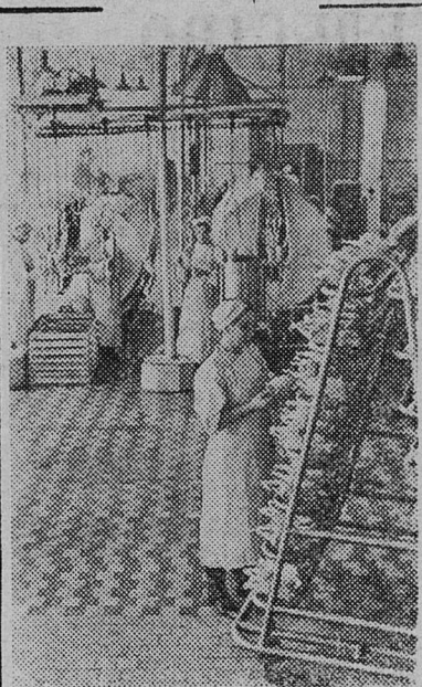
КАЗАХСКАЯ ССР. На Алма-Атинском мясокомбинате пущен птицеперерабатывающий цех. За первые две недели коллектив нового цеха выпустил свыше 30 тысяч куриных тушек.