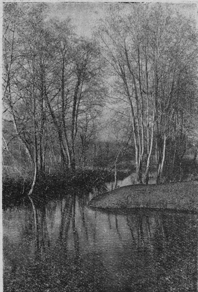
На Кушолке осенью