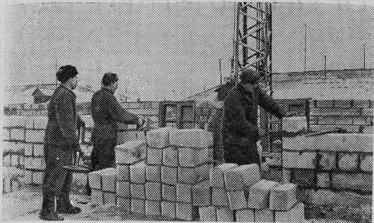
Московская область. На Климовском машиностроительном заводе для строительства жилых домов используется местное сырье — известь и песок, из которых делаются силикатные блоки. На предприятии создан специальный цех для изготовления таких блоков.

На снимке: строительство заводского двухэтажного жилого дома из силикатных блоков.