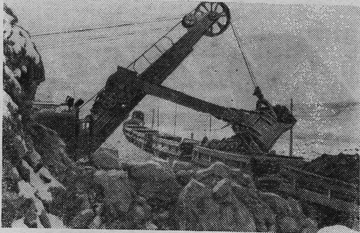
Свердловская область. В тресте «Вахрушевуголь» (гор. Карпинск) произведено укрупнение угольных разрезов, которое дало возможность более рационально использовать горное оборудование, в частности, мощные шагающие экскаваторы, высвободить около 50 работников управленческого аппарата. Годовая экономия от этого мероприятия составит 700 тысяч рублей.