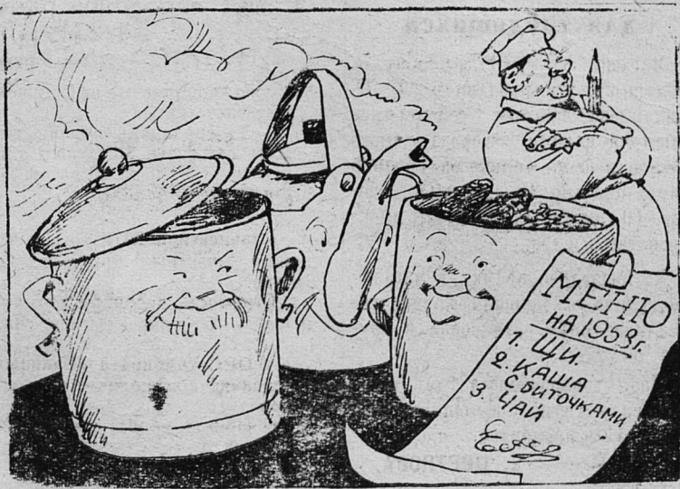
Только о нас и пишем!

Ассортимент блюд в ряде столовых города беден. Выпускается мало рыбных, молочных, овощных кушаний. Меню однообразно. Одни и те же блюда повторяются в каждой столовой.