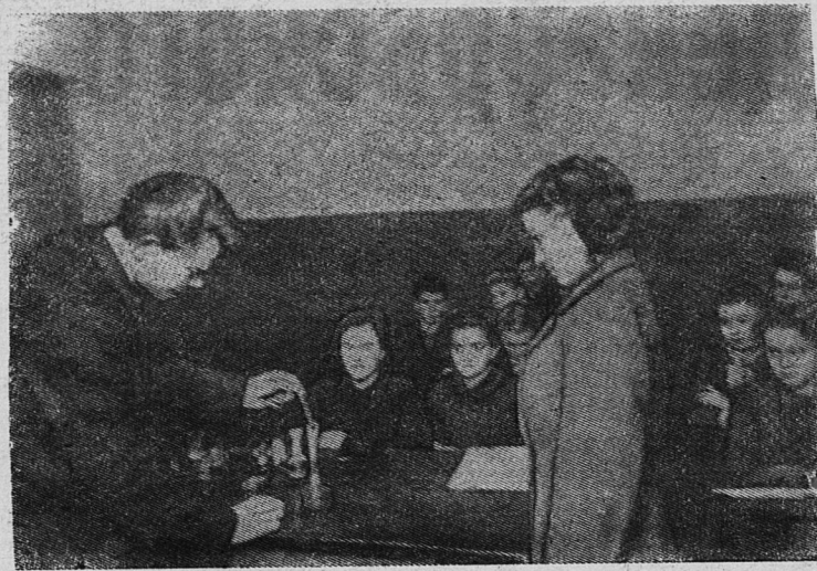
Ленинградская область. В тихвинской средней школе рабочей молодежи в настоящее время без отрыва от производства учится 325 рабочих и служащих города. К 1963 году количество учащихся предполагается довести до 500 человек.